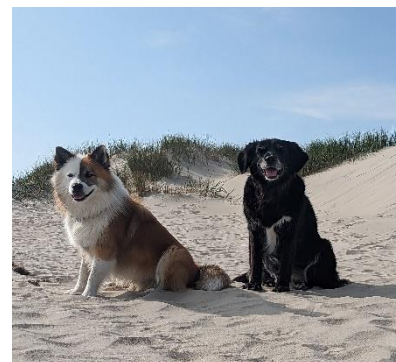
Znorri Snorresson Black Pearl

Elisabeth Scheuer Schulsozialpädagogin und die Schulhunde: